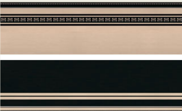
01 F 005 V / 01 KF 005 N