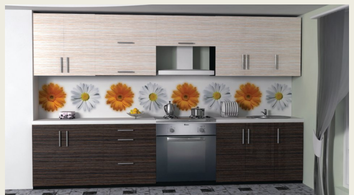
01 KF 016 V / 01 KF 016 N