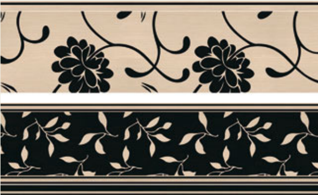
01 F 003 V / 01 KF 003 N