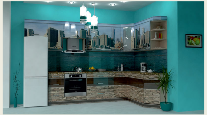
01 KF 006 V / 01 KF 006 N