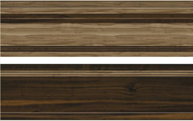
01 KF 002 V / 01 KF 002 N